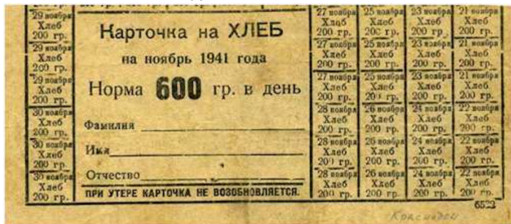
Карточка на хлеб

Карточки получали жители городов и рабочих посёлков, промышленные рабочие предприятий в сельской местности, а также часть сельского населения, которая не была связана с сельским хозяйством: учителя, медики и другие. Существовало несколько категорий занятости: рабочие (занятые физическим трудом), служащие (не занятые физическим трудом) и иждивенцы (не занятые производительным трудом вообще). Для различных категорий работников устанавливались соответствующие нормы распределения продуктов и товаров. Карточки отменили в декабре 1947 г. Для сравнения: в Великобритании карточки на мясо отменили только в 1954 г.