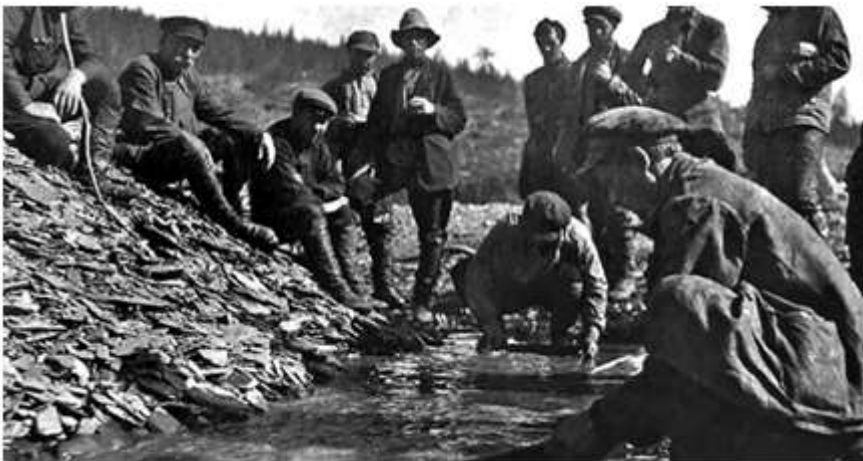
Добыча золота на Колыме

ГУЛАГ занимал определённое место и в экономике страны. В некоторых отраслях труд заключённых был крайне значимым: золотодобыча — 100%, добыча олова — до 70%, никеля — до 33%, древесины — до 15%. В других же отраслях труд заключённых не использовали. Всего общий вклад «лагерной» экономики в экономику страны оценивают на уровне 10%.