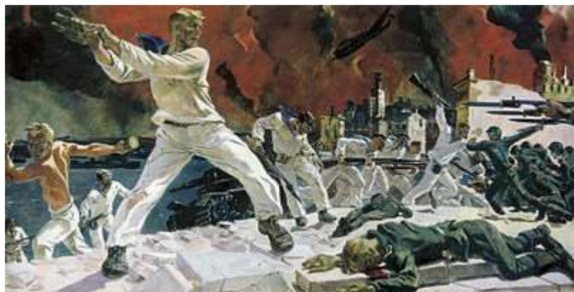
«Оборона Севастополя». А. А. Дейнека. 1942

Василий Тёркин, герой одноимённой поэмы Александра Трифоновича Твардовского (1910–1971), стал олицетворением рядового солдата, труженика войны. В главах из поэмы «без начала, без конца», публикуемых на страницах армейской газеты, перед нами предстаёт русский мужик с хитрецей и смекалкой, мужеством и терпением, не рвущийся в герои, но готовый совершить любой подвиг. Отдельные эпизоды повествования были связаны между собой только главным героем, поскольку по задумке автора являлись полноценными произведениями, ведь в любой момент автор или читатель могли погибнуть.