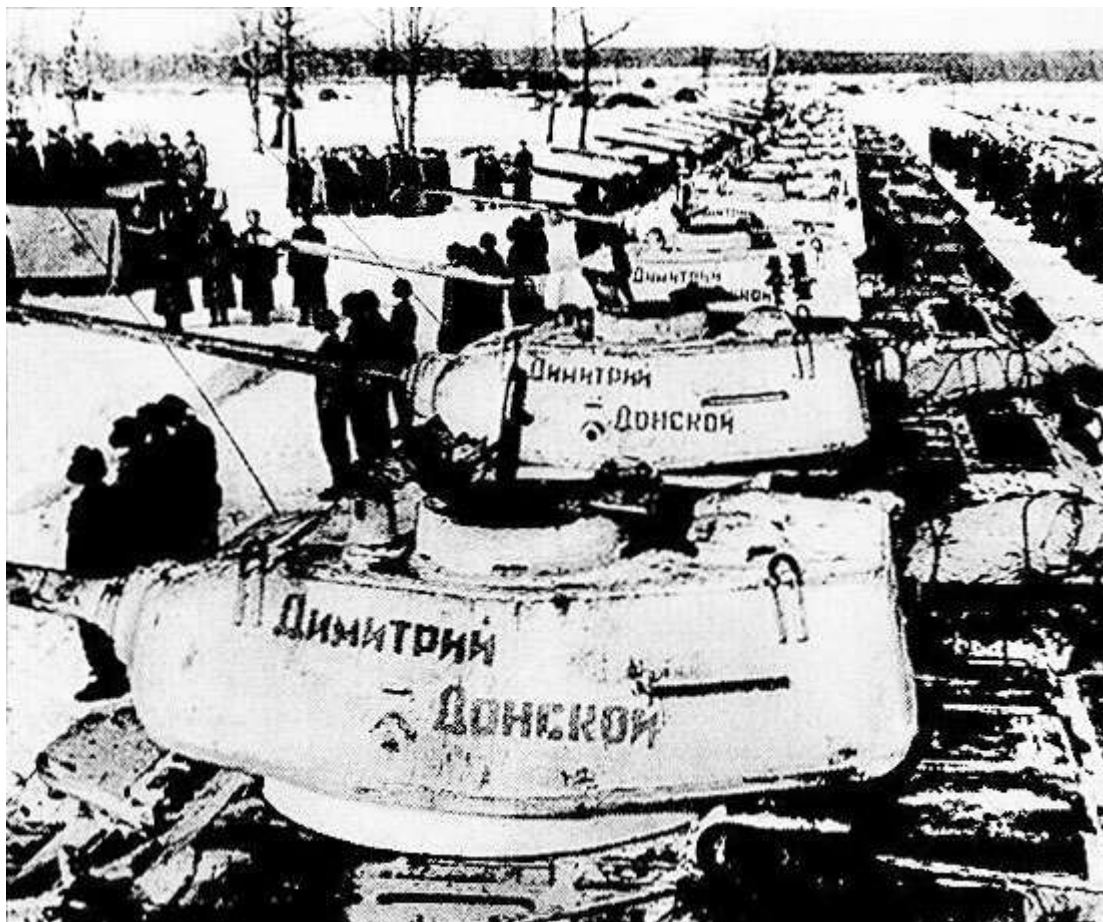
Колонна «Димитрий Донской» в день передачи армии

Уже в первый день войны местоблюститель патриаршего престола митрополит Сергей обратился к православным с посланием, в котором призвал всех верующих к борьбе с фашистскими захватчиками и благословил их. На местах представители церкви развернули широкую благотворительную деятельность: помощь госпиталям, сбор средств, вещей и продуктов для раненых. На денежные пожертвования прихожан в 1944 г. была создана танковая колонна «Димитрий Донской» — 40 танков Т-34 были переданы в Красную Армию. Была также создана авиационная эскадрилья «Александр Невский». Средства собирали даже на оккупированной территории Псковской области, а затем с помощью партизан их передали через линию фронта. Не считая вещей и продуктов, за годы войны православная церковь собрала более 300 млн рублей на нужды фронта. Армяно-григорианская церковь собрала средства на организацию танковой колонны имени Давида Сасунского, мусульмане Уфы собирали деньги на строительство танков, баптисты приобрели транспортно-санитарный самолёт.