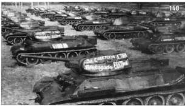
Передача танковой колонны «За Советскую Эстонию» 221-му отдельному танковому полку. 6 мая 1943 г.

В августе 1943 г. вышло постановление «О неотложных мерах по восстановлению хозяйства в районах, освобождённых от немецкой оккупации». Прежде всего необходимо было обеспечить освобождённые территории профессиональными кадрами. Для этого отправляли из эвакуации работников и демобилизовали из армии специалистов с высокой квалификацией,