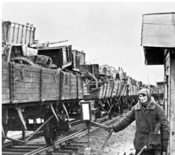
Эвакуация хозяйственного имущества советского оборонного завода на Урал, 1942 г.

Вывезенные предприятия сразу же включались в выпуск необходимой для фронта продукции. Часто продукцию начинали производить на станках ещё до возведения стен новых корпусов. Поэтому к марту 1942 г. советская военная промышленность достигла довоенного уровня производства оружия, техники и боеприпасов, в дальнейшем только увеличивая объёмы.