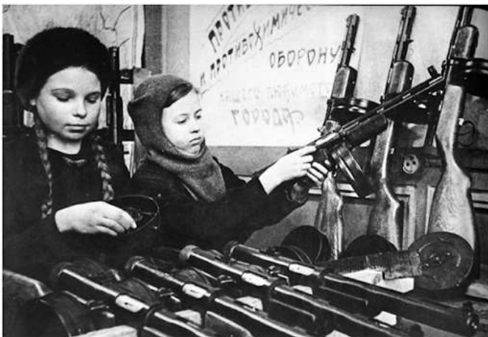
Подростки на военном заводе